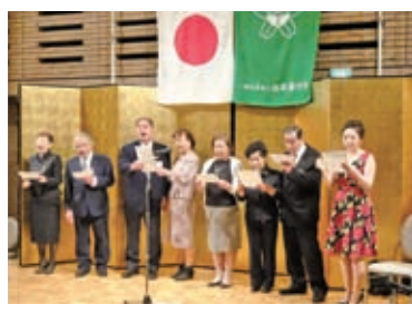
善行会の歌 (芸能奉仕団)