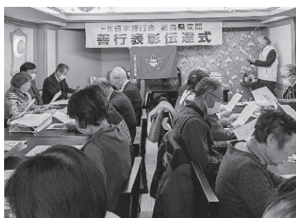
令和六年度秋季善行表彰伝達式

伝達式には、受賞者(個人二人・五団体)十人と支部役員十六人が出席。初めに善行会の歌を斉唱後、明治神宮参集殿の表彰式に参加できなかった受賞者へ賞状を伝達しました。