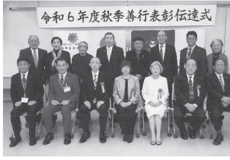
令和六年度秋季善行表彰伝達式

佐賀県唐津支部の令和六年度秋季善行表彰状伝達式を、十一月十六日(月)唐津市役所大会議室において開催しました。今年度の秋季善行表彰は四人が受賞しました。会場にはご来賓に峰唐津市長、笹山唐津市議会議長、栗原市教育長等のご臨席を賜り、四人の受賞者にご祝辞で善行を褒め称えられ、受賞者の