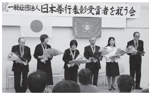
一般社団法人日本善行会 受賞者を祝う会

同で祝う、伝統の催しです。当日は釧路市長、白糖町長のおたのしみご祝辞を賜り、花束・記念品贈呈に続いて、受賞者お一人お一人から謝辞をいただきました。それぞれの長年の地道な活動が垣間見える、大事な時間となりました。まだまだ地域においてご推薦すべき方がたくさんおられます。支部活動を活性化し、進めて行きたいと思っております。