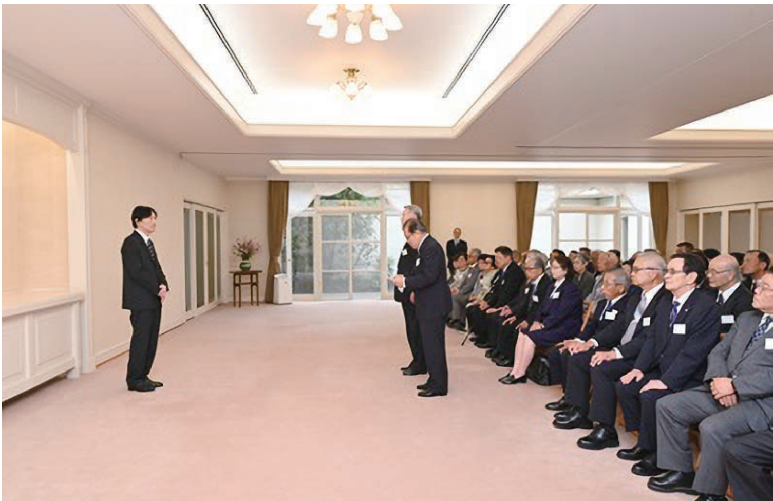
インターネット本会ホームページでも同じ写真がご覧になれます。